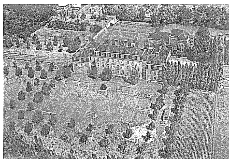
Luchtfoto van het domein Martens Sotteau. Op de voorgrond het nieuwe weeshuis met daarachter het Sint-Camillus gesticht, nu de Edugo kleuterschool.