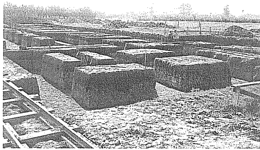
1948: deze foto van de grondvesten toont ons duidelijk hoe robuust het gebouw zou worden.

In zijn met de hand geschreven testament van 20 september 1931 laat hij een groot deel van zijn fortuin na aan de "Association des Filles de la Charité de Saint Vincent de Paul de la Province