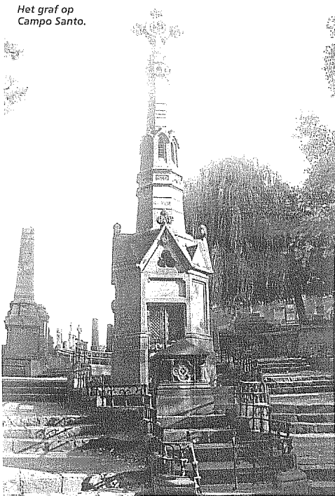
Het graf op Campo Santo.